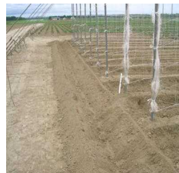
写真4 枕地の溝切り