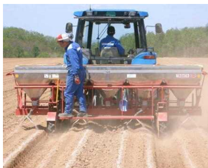
写真2 表層施肥の作業事例 (成畦の肩口に施肥)

催芽温度は、24℃で一定(20~22日間)にするか、26℃で10日間処理した後20℃まで徐々に下げる。催芽湿度は80%を目標とし、湿度計を確認しながら換気等により調節する。催芽湿度を80%とすることで期間は28~35日程度かかるが、植付後の萌芽が早まり、揃いも良く、不萌芽率が極めて低くなる(令和2年普及奨励事項)。芽の大きさや揃いを確認