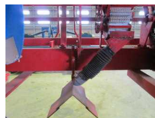
肥料が2方向に落ちる ように排出口を改造

しながら、コンテナの上下および内外の積み替えを行う。目標とする芽の大きさは、作業性を重視する場合には芽の直径が6~8mmの未分化芽とし、萌芽揃いや萌芽期の前進を重視する場合には、つるといもの区別が明瞭で、つるが1cmに伸びた状態(分化始~分化1cm)とする。催