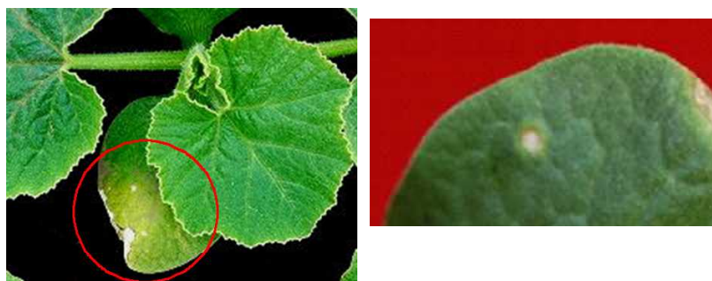
写真1 かぼちゃ苗に発生した果実斑点細菌病の病斑

発病苗をやむを得ず使用する場合は、健全苗から隔離し薬剤を茎葉散布する(「かぼちゃの突起果の発生原因解明と防除対策」平成26年指導参考事項)。