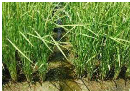
写真1 出穂後の溝切り