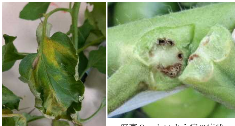
写真2 かいよう病の症状

かいよう病（写真2）は、ハウス内の温度や湿度が高まる条件下で発生しやすく、摘葉や脇芽かき等の作業で2次感染する。発生ほ場では換気をよくし、罹病株の早期抜き取りを徹底し、登録薬剤の散布を行う。また、脇芽かきや収穫作業では、はさみの消毒や手袋の交換など未発生株や未発生ほ場への感染防止対策を講じる。